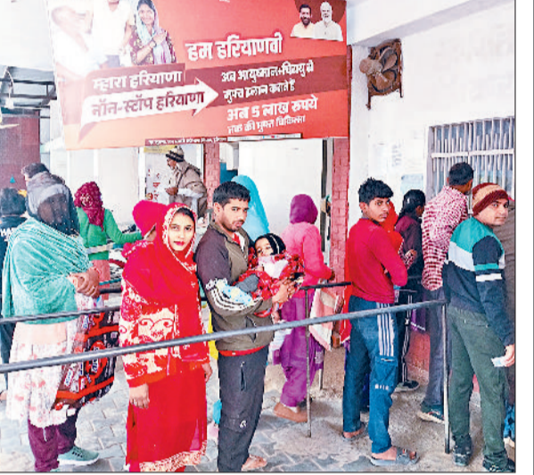
महम। पर्वी बनवाने के लिए खिड़की के सामने लाइन में लगे मरीज।