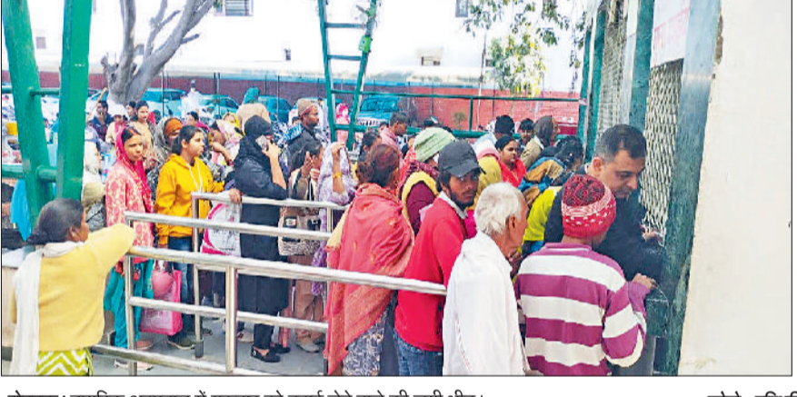
रोहतक। नागरिक अस्पताल में गुरुवार को दवाई लेने वाले की लगी भीड़।

वहीं एसोसिएशन का दावा है कि चौथे दिन की हड़ताल में 99 प्रतिशत डॉक्टर शामिल हुए। ओपीडी, आपातकालीन सहित इंडोर सेवाओं में ड्यूटी नहीं दी गई। वहीं स्वास्थ्य विभाग का कहना है कि मरीजों को किसी तरह की कोई परेशानी नहीं होने दी गई। उनका