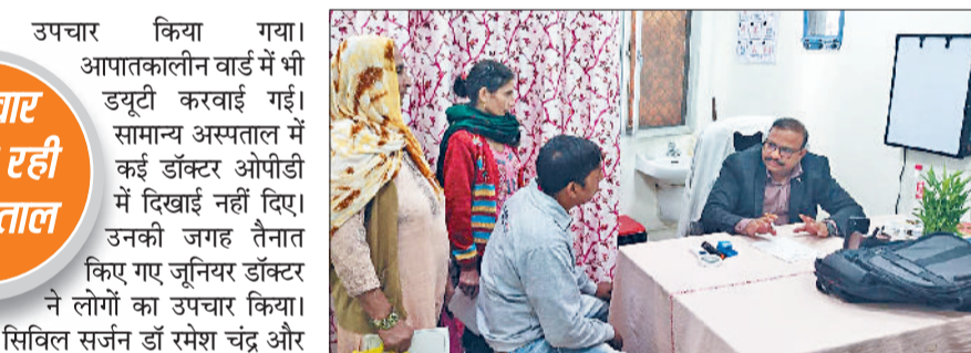
रोहतक। नागरिक अस्पताल में मरीजों की जांच करते डॉक्टर।