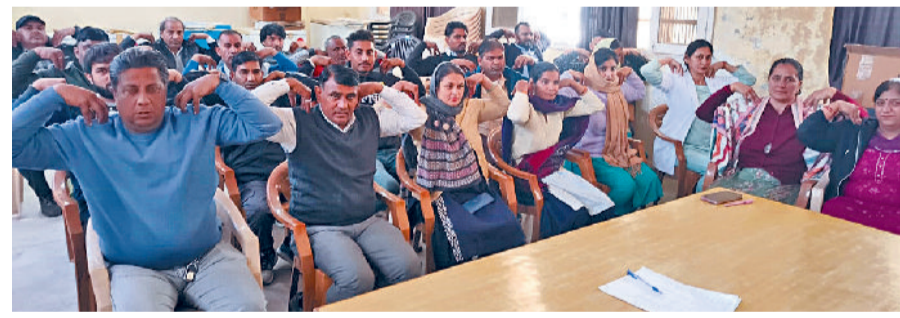
महम। आयुष विभाग द्वारा उपमंडल नागरिक अस्पताल महम में एक योग कैंप लगाया गया। इस कैंप में अस्पताल के कर्मचारियों ने भाग लिया। आयुष योग टॉवर विकास सिवाव के सरकारी अस्पतालों के कर्मचारियों को योग की ट्रेनिंग दी। योग टॉवर ने योग सधकों को बताया कि योग करने से व्यक्ति स्वस्थ रहता और बीमारियां नहीं लगती। जहां योग के जरिए शरीर को ठीक किया जाता है उसी प्रकार मेंडिटेनशन करके हम मानसिक स्वास्थ्य को भी ठीक कर सकते हैं। 25 नवंबर से सरकारी कार्यालयों में योग बेक सेशन शुरू किए गए हैं। 12 दिसंबर को योग मेंडिटेनशन दिवस मनाया जाएगा।